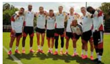
Los teutones ponen primera.

Alemania enfrenta a la debutante Curazao desde las 14 en el En el NRG Stadium de Houston, por la primera fecha del Grupo E. El partido será arbitrado por el marroquí Jalal Jayed y podrá verse por DSports y Paramount+. El conjunto de Julian Nagelsmann busca redimirse tras sus decepcionantes eliminaciones en fase de grupos en Rusia 2018 y Qatar 2022. Con una base renovada que combina la experiencia de Manuel Neuer con el talento joven de Jamal Musiala y Florian Wirtz, los teutones intentarán imponer su jerarquía ante una Curazao que vive un sueño. El éxito del equipo caribeño se