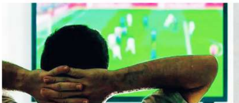
Cuidado. La pasión mundialista puede jugar una mala pasada.

Con información, hábitos saludables y atención a las señales del cuerpo, es posible vivir cada gol, cada definición y cada emoción del Mundial 2026 con el corazón preparado para acompañar la fiesta del fútbol. ■