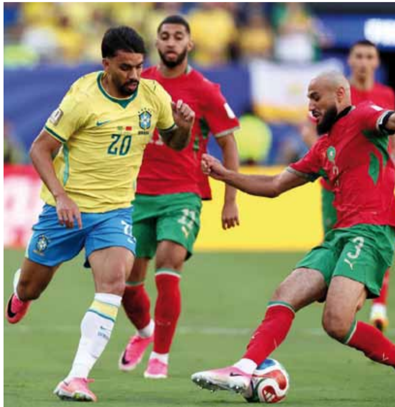
Paridad. El pentacampeón jugó un flojo partido en su estreno en la Copa.

La Canarinha intentó inclinar la balanza mediante la circulación de balón y las proyecciones