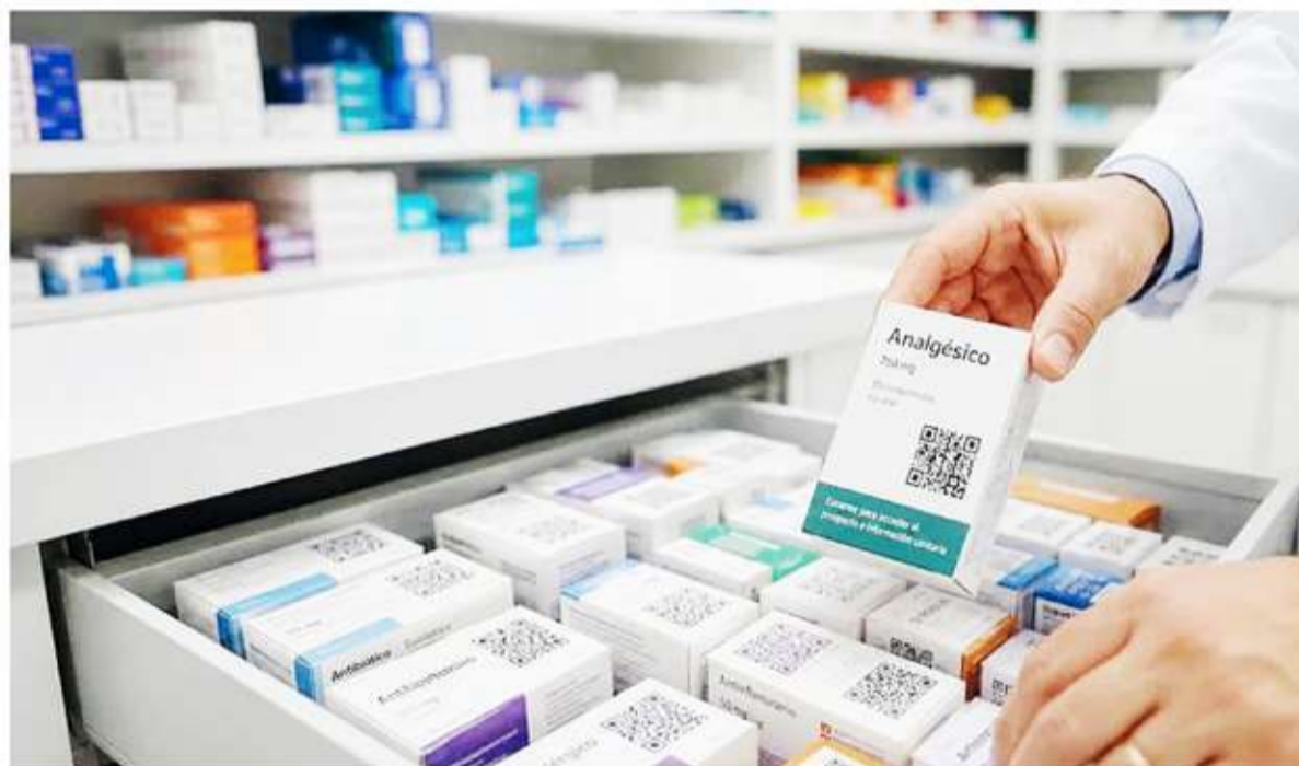
QR o Data Matrix. Los remedios deberán incorporar un código digital.

Las bases científicas que recomiendan dormir en oscuridad total se apoyan en el estudio de hormonas y procesos biológicos nocturnos. Cuando hay luz por la noche, en particular la de dispositivos electrónicos o lámparas, el cerebro recibe una señal ambiental