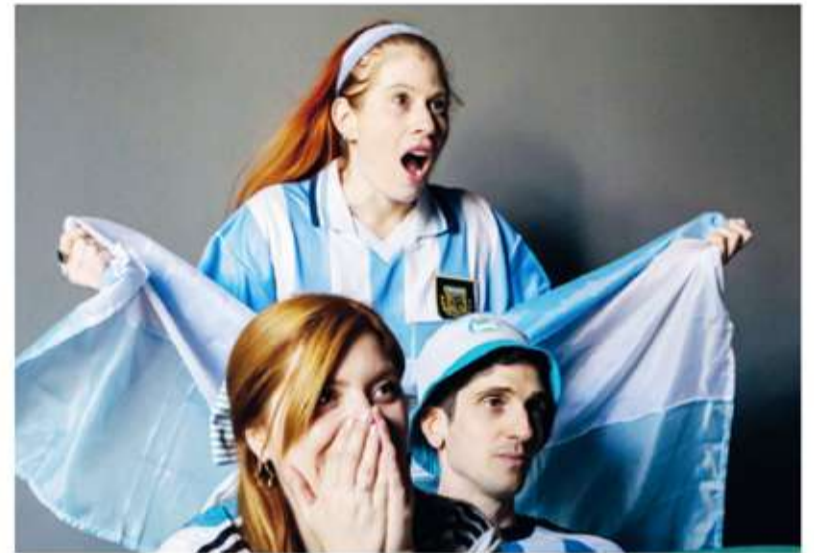
Nervios. El Mundial es un cóctel de ansiedad y emociones intensas que puede afectar la salud.

los pacientes con antecedentes cardíacos, hipertensión arterial, diabetes, colesterol elevado o enfermedades cardiovasculares previas deben extremar los cuidados durante el torneo. Una de las recomendaciones más importantes es no abandonar los tratamientos habituales ni modificar la medicación sin supervisión médica.