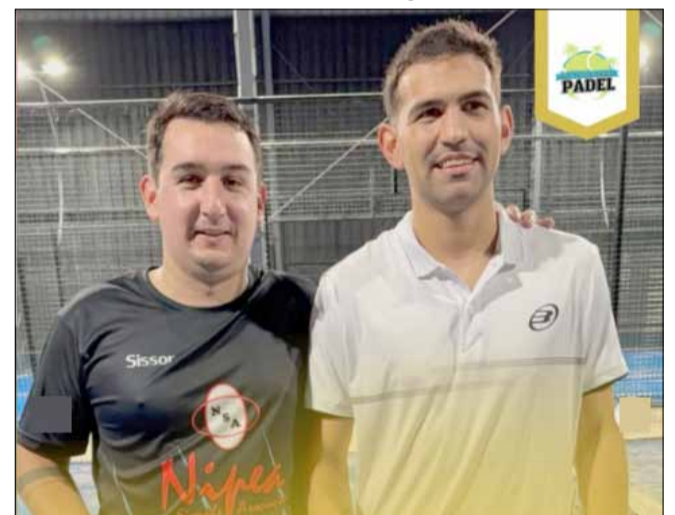
Delpian - Schiebelbain, ganadores en Sexta.