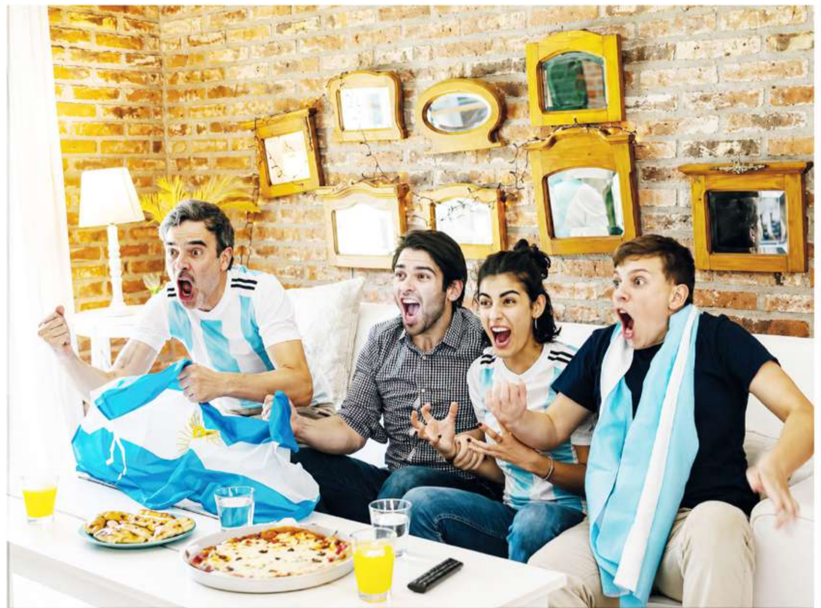
Pulsaciones a full. Las emociones fuertes activan mecanismos fisiológicos que elevan la frecuencia cardíaca y la presión arterial.