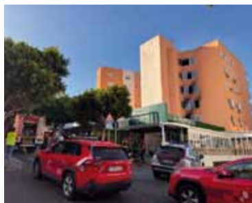
Incendio. Se propagó con rapidez en el complejo de nueve pisos.

El siniestro comenzó alrededor de las 5 de la madrugada en la tercera planta de un edificio resi-