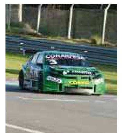
Líder. La Honda Civic se escapa.