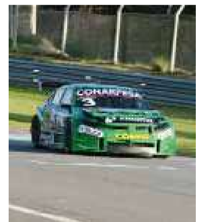
Líder. La Honda Civic se escapa.

Ahora, el conjunto nacional deberá cambiar rápido el chip para afrontar la seguidilla de los siete partidos que tienen por delante en el calendario. Argentina buscará dejar atrás este mal trago y volverá a presentarse el próximo miércoles ante Australia, desde las 13, con el objetivo de recuperar el terreno perdido.