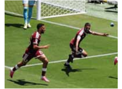
Khokhi desató la locura.

Qatar hizo historia al sumar su primer punto en una Copa del Mundo tras rescatar un agónico empate 1-1 ante Suiza en San Francisco, durante la primera fecha del Grupo B. El encuentro, disputado con alta intensidad, dejó un balance de justicia repartida por la falta de eficacia helvética.