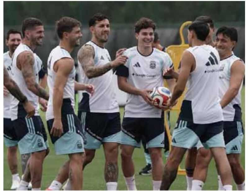
Buen humor. El grupo se distiende mientras Scaloni arma el rompecabezas.

La evolución de "Dibu" genera optimismo dentro de la delegación argentina, que espera contar con una de sus máximas figuras desde el comienzo del torneo. Su presencia representa un factor fundamental para las aspiracio-