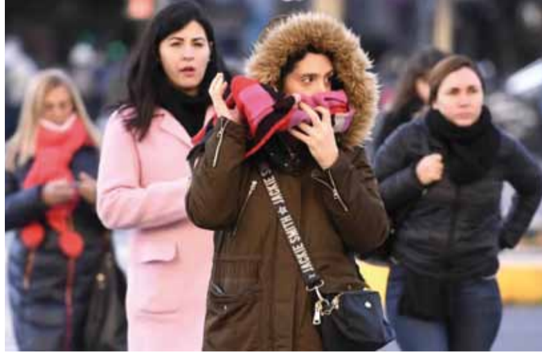
Con campera. Hoy y mañana feriado predominará el cielo despejado, pero el frío seguirá siendo protagonista.

Hoy y mañana feriado predominará el cielo despejado, pero el frío seguirá siendo protagonista. En el Área Metropolitana de Buenos Aires las temperaturas mínimas oscilarán entre -1^{\circ}\text{C} y 3^{\circ}\text{C} , mientras