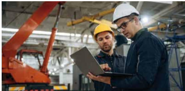
Alarma. El fenómeno atraviesa tanto al sector privado como al público.

La comparación interanual tampoco ofrece señales alentadoras. Respecto de marzo de 2025, el empleo asalariado disminuyó 1,2%, equivalente a 116.500 trabajadores menos. El sector privado