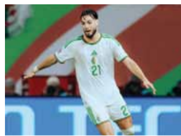
¿Juega? El defensor quiere estar.

Sin embargo, la situación comenzó a cambiar en las últimas horas. Bensabaini participó de la práctica del seleccionado dirigido por Vladimir Petkovic y encendió la ilusión de poder integrar la formación titular. Su evolución será seguida de cerca durante los próximos días, aunque su